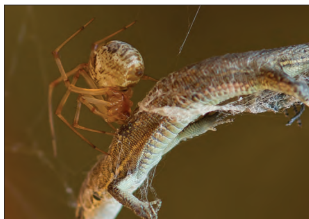
Рис. 2. Самка паука Parasteatoda tepidariorum кусает ящерицу Darevskia pontica . Заметен некроз тканей на месте укуса

сала в спину еще живую ящерицу. На кожных покровах рептилии в месте инокуляции яда был отчетливо виден некроз тканей (рис. 2). При каждой новой попытке ящерицы высвободиться, паук возобновлял спеленывание жертвы паутиной, при этом им были опутаны ее передние и задние конеч-