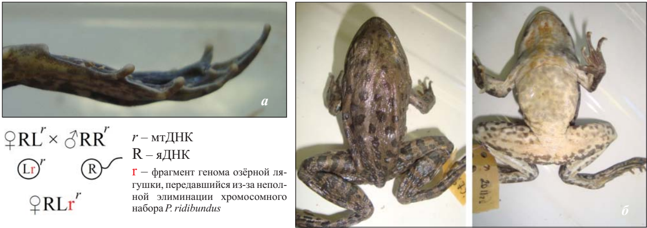
Рис. 3. Возможное происхождение особи P. esculentus , имеющей увеличенное количество яДНК, и ее внешний вид: а – пяточный бугорок и первый палец задней конечности, б – вид особи сверху и снизу