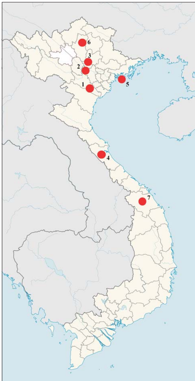
Рис. 3. Местонахождения экземпляров Acanthosaura lepidogaster , находящихся в герпетологической коллекции ЗММУ. Подписи к местонахождениям см. табл. 3