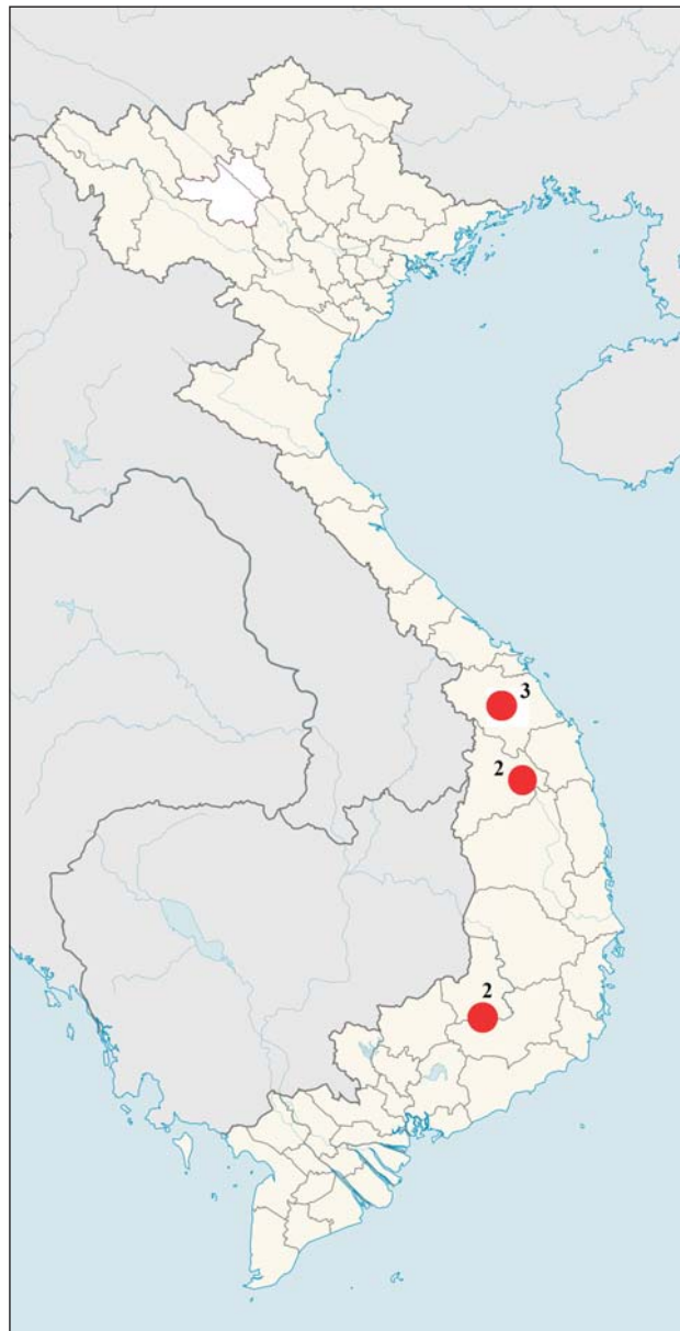
Рис. 4. Местонахождения экземпляров Acanthosaura nataliae , находящихся в герпетологической коллекции ЗММУ. Подписи к местонахождениям см. табл. 4