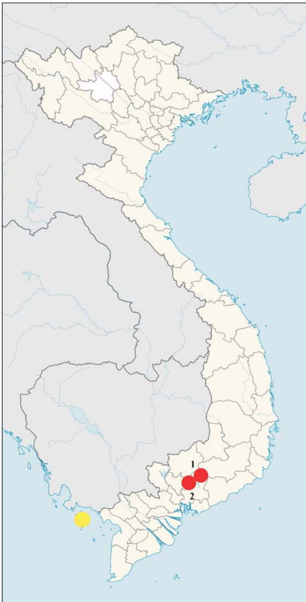
Рис. 1. Местонахождения экземпляров Acanthosaura capra (●) и Acanthosaura cardamomensis (●), находящихся в герпетологической коллекции ЗММУ. Подписи к местонахождениям см. табл. 1

Acanthosaura coronata Günther, 1861. От других видов рода, имеющих затылочные шипы, отличается отсутствием диастемы (промежутка) между затылочным и спинным гребнями. Во Вьетнаме была известна из провинций Ламдонг и Донгнай (Ананьева и др., 2008; Бобров, Семенов, 2008) (рис. 2), а за пределами Вьетнама – из Кам-