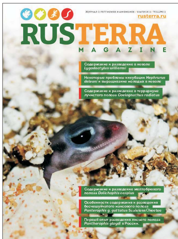
Обложка второго номера журнала «RusTerra magazine»

Идея создания специализированного журнала для террариумистов возникла давно, но реальное практическое воплощение она получила лишь в конце 2014 г., прежде всего, благодаря усилиям одного из авторов данной статьи (Н. Г. Крымов). Конечно, были сомнения в жизнеспособности идеи. На интернет-форумах среди любителей проходили активные обсуждения. Были и сторонники, и противники журнала. Последние считали, что «согласно современным тенденциям оперативная информация в интернет-сообществах не даст возможности для развития печатных форм». Очевидно, что специализированные форумы террариумистов – это достаточно ёмкая, многоуровневая, но не всегда достоверная информация, и не каждый любитель, которому необходимы материалы по конкретному виду, сможет разобраться в этих ресурсах. Поэтому мы рассматриваем интернет-сообщества не как конкурирующую составляющую, а как один из альтернативных источников для получения информации о содержании рептилий. К тому же печатные издания – это, прежде всего, ответственные и оригинальные авторские материалы, часто гораздо более многоплановые и всеобъемлющие.