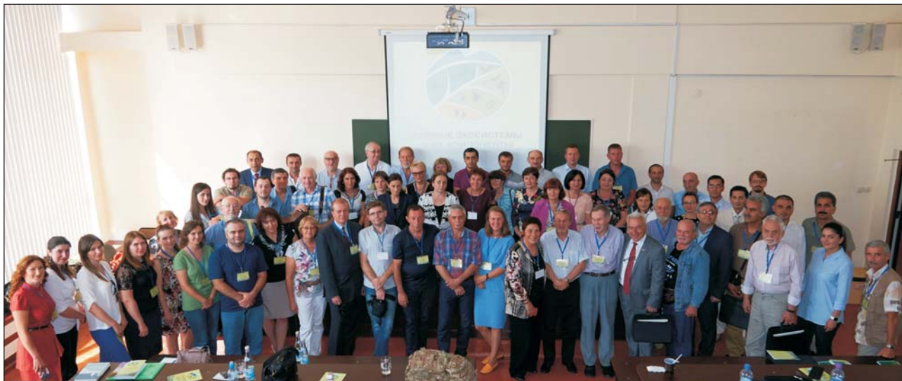
Участники VI Всероссийской конференции с международным участием «Горные экосистемы и их компоненты» (Россия, Нальчик, 11 – 16 сентября 2017 г.)

на территории ООПТ, занимающих площадь около 827.8 км 2 (т. е. около 10% от всей площади республики), зарегистрировано соответственно 8 и 20 видов.