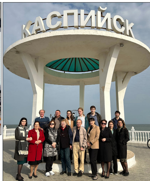
Участники Международной конференции «Герпетологические исследования Каспийского бассейна». Россия, Дагестан, Каспийск, 3 – 4 ноября 2023 г.

Participants of the International conference “Herpetological Studies in Caspian Basin”. Russia, Dagestan, Kaspiysk, November 3–4, 2023