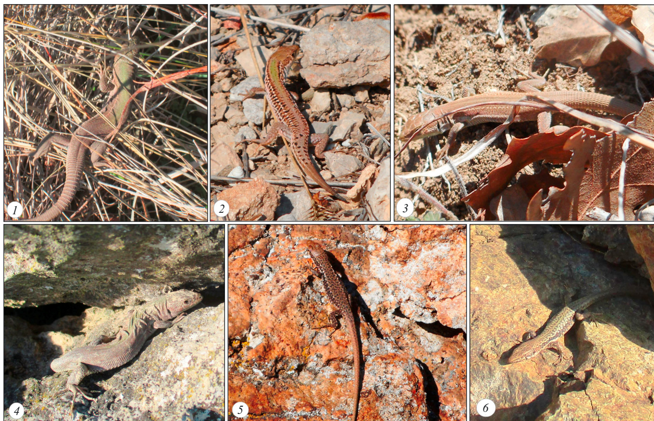
Рис. 3. Примеры зимней активности лацертид в юго-восточном Крыму: Podarcis tauricus : 1 – Карадагская долина, 08.12.2017 г.; 2 – хребет Беш-Таш, 31.12.2020 г.; 3 – Карадагская долина, 05.02.2021 г.; 4 – пос. Биостанция, 26.12.2023 г.; Darevskia lindholmi : 5 – гора Святая, источник Гяур-Чешме, 05.02.2021 г.; 6 – побережье хребта Карагач, 28.12.2023 г.