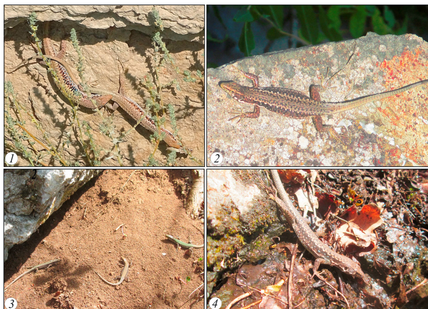
Рис. 4. Некоторые аспекты биологии Darevskia lindholmi в восточном Крыму: 1 – позднее летнее спаривание, гора Сырт-Кая, окрестности с. Вишенное, Белогорский район, 19.07.2019 г. (самец удерживает самку за основание хвоста, вскоре на поверхности почвы наблюдалась копуляция); 2 – самая поздняя регистрация беременной самки в Карадагском заповеднике и Крыму в целом, скалы над источником Гяур-Чемше, 26.08.2023 г.; 3 – необычное скопление ящериц близ источника Гяур-Чешме в период экстремальной засухи, 18.04.2020 г.; 4 – пьющая воду ящерица возле источника, 09.04.2020 г.